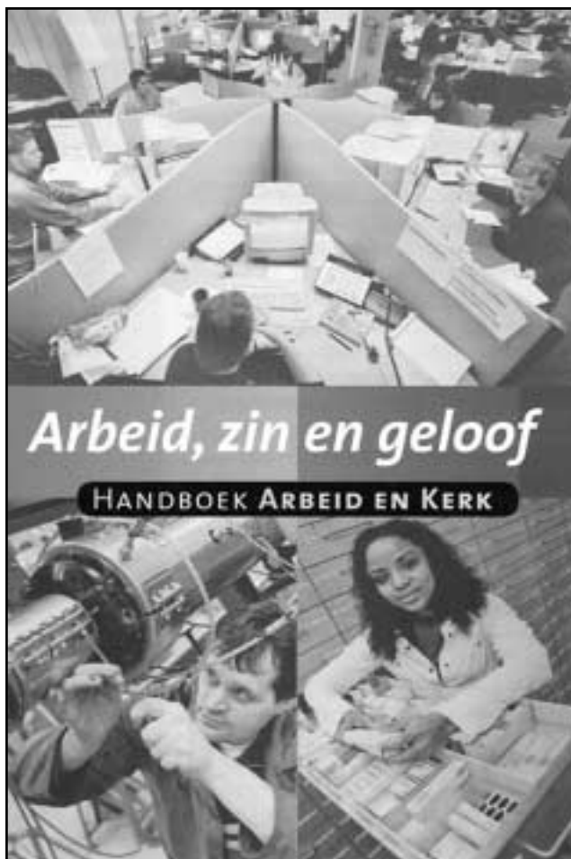
Arbeid zin en geloof

In september verscheen 'Arbeid, zin en geloof', een oecumenisch opgezet handboek dat verbinden legt tussen arbeid en kerk. Het is een informatief boek, met een uitgebreide verkenning van wat arbeid eigenlijk is en hoe arbeid in pastoraat, diaconiel liturgie en catechese een rol speelt. Het is ook een praktisch boek met voorbeelden uit de kerkelijke praktijk en vele suggesties om in eigen parochie of gemeente mee aan het werk te gaan.