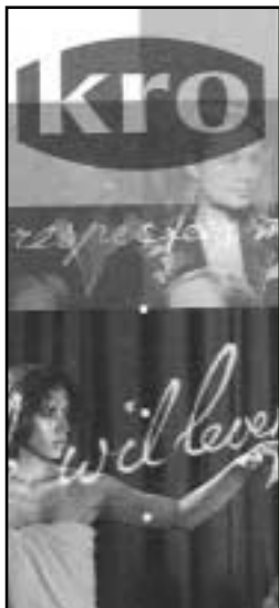
'ik wil leven'

"Ik wil leven", in deze zin verstaat ook de Kerk dit Woord: 'Het menselijk leven is heilig omdat het vanaf zijn oorsprong getekend is door Gods scheppende activiteit en voor altijd een speciale relatie blijft bewaren met zijn Schepper, zijn enige einddoel.' (KKK nr.2258, blz.476). Hieruit vloeien enerzijds een afwijzen van abortus en euthanasie voort en anderzijds een actief streven naar vrede en een diepgaand respect voor de lichamelijke en geestelijke integriteit van ieder persoon.