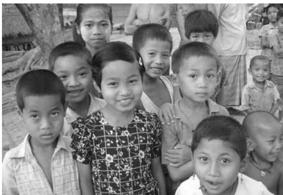
Een van de door De Regenboog gekozen Vastenactieprojecten in 2008: Caritas Bangladesh.

Op diaconaal vlak heeft de federatie gekozen voor een pragmatische aanpak, een groei van samenwerking tussen werkgroepen van onderop. De meeste parochies kennen een PCI en een MOV-groep. Twee parochies hebben ook nog een werkgroep diaconie. Toen in 2003 het pastoraal team een beleidsplan had ontwikkeld, is het concept ook besproken in een gezamenlijk overleg van alle diaconale groepen. Maar bij