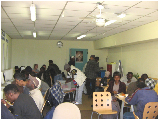
Het inloopcentrum van Jongeren Op Doortocht.

omstandigheden in Amsterdam Zuid-Oost rondzwerfen, zijn hiv-geïnficeerd. “Met het project ‘Jongeren Op Doortocht’ probeert Dube hen de goede richting op te sturen”, klonk het in de reportage.