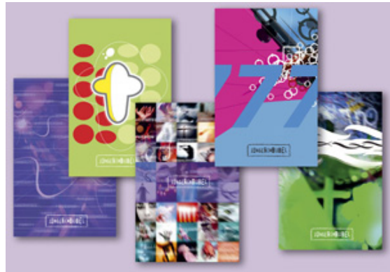
De vijf omslagen van de Jongerenbijbel .

waarderen. Ook volwassenen hebben laten weten de Jongerenbijbel op prijs te stellen", aldus het bijbelgenootschap. Ook van de tweede oplage is al een aanzienlijk deel via nieuwe bestellingen verkocht. Het NBG en de EO verwachten dat ook die binnen afzienbare tijd uitverkocht zal zijn. De Jongerenbijbel heeft extra's als kaartjes en rubrieken die helpen bij het bijbellezen. Jongeren kunnen zelf bepalen welke van de vijf bijgeleverde omslagen zij voor de Jongerenbijbel willen gebruiken. Voor informatie en bestelling: www.jongerenbijbel.nl .