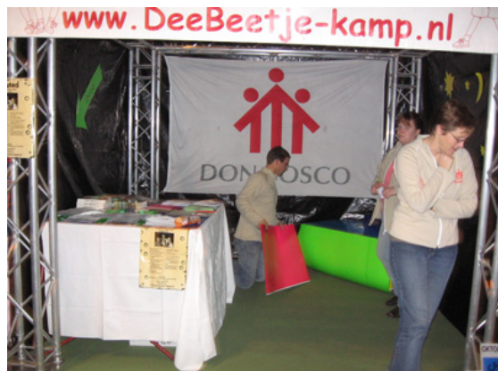
Vrijwilligers van de DeeBeetje kampen bouwen hun informatiestand op.

- Vrijwilligers van de DeeBeetje-kampen stonden 5 november met een stand op de Katholieke Jongerendag in Nieuwegein. Zo'n 1800 jongeren bezochten de landelijke bijeenkomst. De Don Bosco Groep Nederland had gezorgd voor nieuwe folders over Don Bosco Nederland.