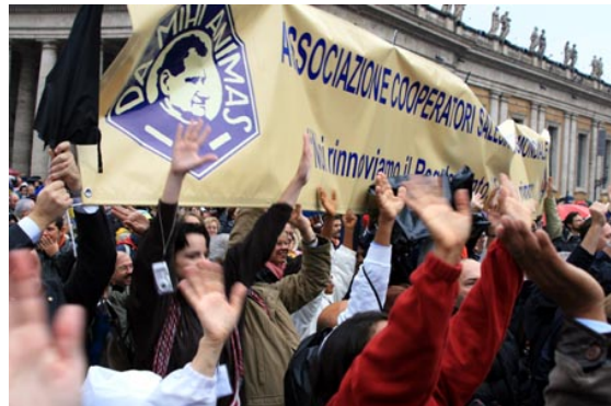
Deelnemers aan het congres juichen paus Benedictus XVI bij het Angelusgebed, 12 november op het Sint Pietersplein.