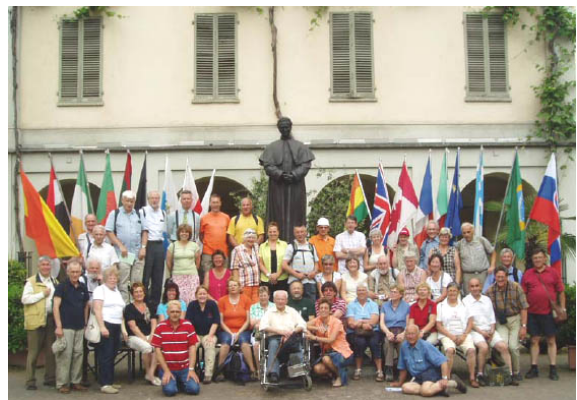
Het reisgezelschap in de Turijnse wijk Valdocco, waar Don Bosco met zijn levenswerk begon.