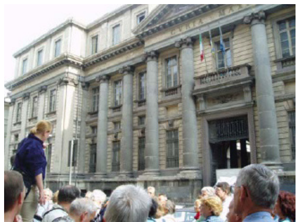
Bij het hooggerechtshof in Turijn, waar ook Don Bosco regelmatig kwam om gevangenen te bezoeken.

De tweede dag had Colle Don Bosco tot doel, waar het huisje van Don Bosco, het huis van diens broer Giuseppe en verschillende bezienswaardigheden werden bezocht.