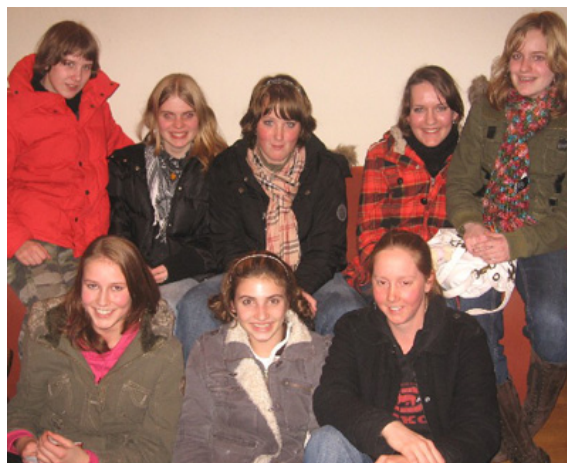
De jongeren uit Benthuizen en Hazerswoude-Dorp bijeen in het Amsterdamse Don Bosco Huis.

ontmoeting lag in handen van het Rode Kruis. Tot slot bezocht de groep de zusters Augustinessen, die jonge moeders met kinderen opvangen als ze door omstandigheden op straat terecht komen. Terug in het Don Bosco Huis werd de oriëntatiedag afgesloten met pannenkoeken bakken en een bezinnende afsluiting in de crypte van het huis.