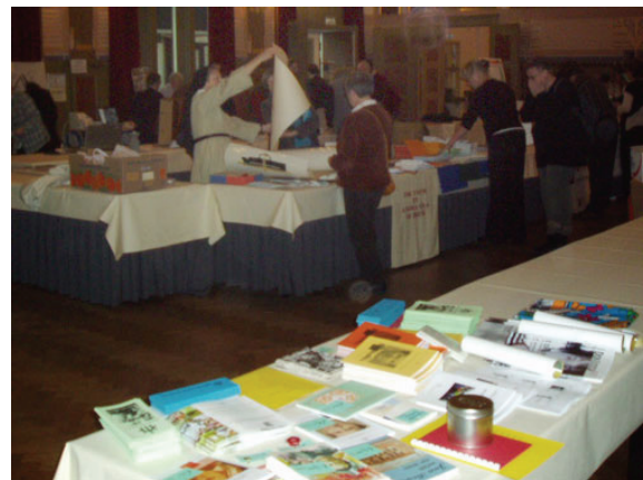
Don Bosco-materiaal uitgesteld op de informatiemarkt.