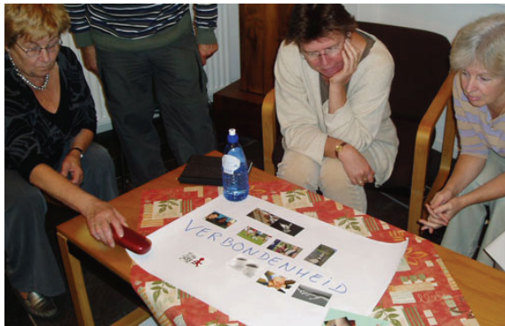
Medewerkers van Don Bosco buigen zich over het thema 'verbondenheid'.