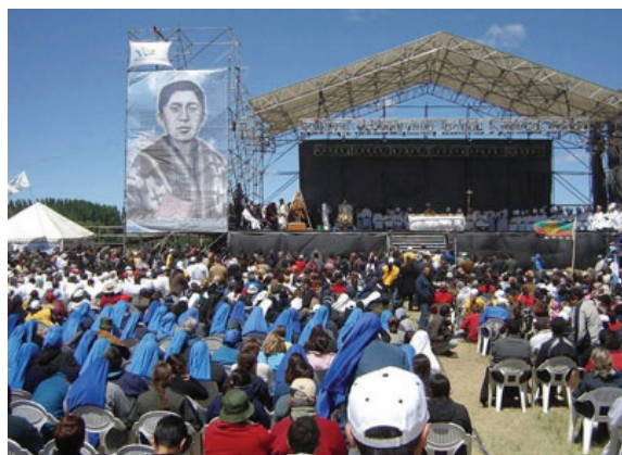
Beeld van de zaligverklaring van Ceferino Namuncurà in het Argentijnse Chimpay.

De nieuwe zalige, zoon van de Indiaanse koning Manuel Namuncurà die een van de grootste Indiaanrijken leidde, behoorde tot het volk van de Mapuche, dat vroeger grote delen van Argentinië en Chili bevolkte maar in de negentiende eeuw vrijwel is uitgeroeid. Hij was een leerling van de salesianen en volgde een priesteropleiding in Rome. Daar stierf hij op negentienjarige leeftijd in 1905 aan tuberculose. In 1924 werden zijn stoffelijke resten overgebracht naar Argentinië, waar hij sindsdien als een volkshelige wordt vereerd. De procedure tot de zaligverklaring begon in 1944. Voor een zaligverklaring is minimaal één wonder nodig dat op voorspraak van de kandidaat-zalige is geschied. Afgelopen juli erkende het Vaticaan officieel de wonderbaarlijke genezing van een vrouw die aan baarmoederkanker leed. Op een zaligverklaring kan later nog een heiligverklaring volgen als opnieuw een wonder wordt erkend.