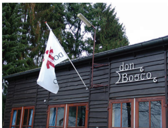
De Kampschuur van Assel Don Bosco Centrum.

- Assel Don Bosco Centrum houdt op 27, 28, 29 en 30 december 'Open Huis' voor wie rond de Kerst even op adem wil komen in de prachtige omgeving van het centrum. De kosten per persoon per dag bedragen 15 euro. Meer informatie is te vinden op de website www.asseldonboscocentrum.nl .