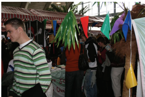
Drukte bij de Don Bosco-stand op de Katholieke Jongerendag in Den Bosch.

- 'Meiden voor Meiden!' is een project van Don Bosco Jonathan voor zwerfmeiden, thuisloze jonge moeders en zwangere meiden. Vaak hebben ze alleen contact met jongeren die ze op straat tegenkomen of in opvanghuizen. Het project biedt deze jonge vrouwen de mogelijkheid om samen met niet-thuisloze leeftijdgenoten sociaal actief te zijn en interesses te ontwikkelen. De vrijwilligers van Don Bosco Jonathan zijn geselecteerd en getraind om met deze kwetsbare doelgroep om te kunnen gaan. Ze ondernemen een half jaar lang, één dagdeel per week activiteiten met (ex) thuisloze jonge moeders of (zwangere) meisjes, uiteenlopend van een bezoek aan Artis en een rondvaart door de Amsterdamse grachten tot fitnesssen of bijkletsen op een terrasje. Op 8 november was de lokale omroep AT5 bij een van de uitstapjes. De reportage is te zien op het webadres www.kortamsterdams.nl/web/2007/11/13/dinsdag-13-november-2007/ .