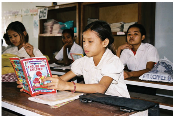
Cambodjaanse kinderen in een Don Bosco-school.