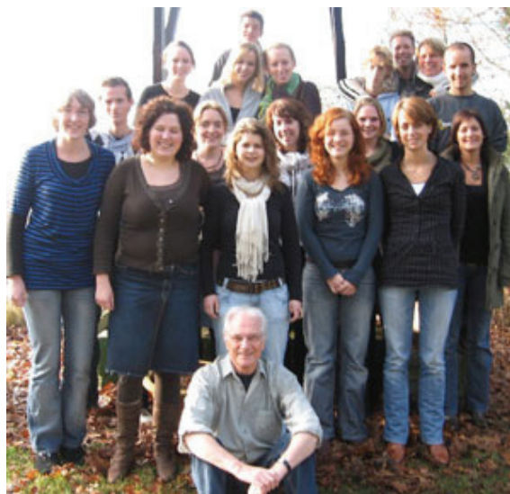
De deelnemers aan het straatkinderenweekend in Assel.