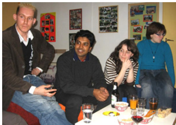
Bijpraten op het Don Boscofeest in Amsterdam.

- Op woensdagavond 31 januari, de feestdag van Don Bosco, is in het Don Bosco Huis Amsterdam het jaarlijkse 'Don Bosco Feest' gehouden.