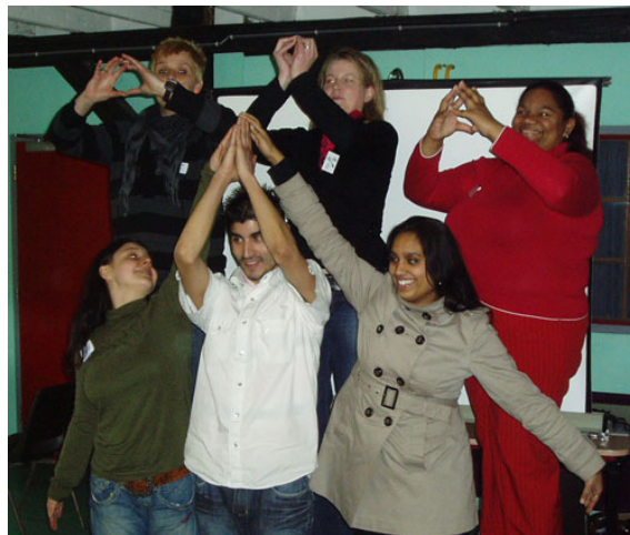
De stagiaires in een spelsituatie tijdens de trainingsdag.

kelingen in de wereld van jeugd en jongeren. De organisatie was in handen van de Don Bosco Groep Nederland.