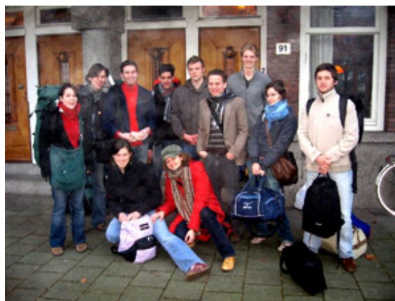
De Hongaarse jongeren met enkele Nederlandse leeftijdgenoten poseren bij het Amsterdamse Don Bosco Huis.

feeshop maakte duidelijk waar je de jongeren in een stad als Amsterdam kunt ontmoeten. Daar stonden we stil bij het Nederlandse gedoogbeleid ten aanzien van het gebruik van softdrugs. Een viering in Nicolaaskerk maakte veel indruk op de jongeren. Na de viering dronken we in de kerk koffie en konden onze gasten kennismaken met andere jonge mensen die betrokken zijn bij het werk van Don Bosco in Amsterdam."