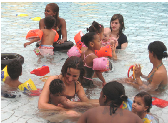
Zwemmen met Don Bosco Jonathan.