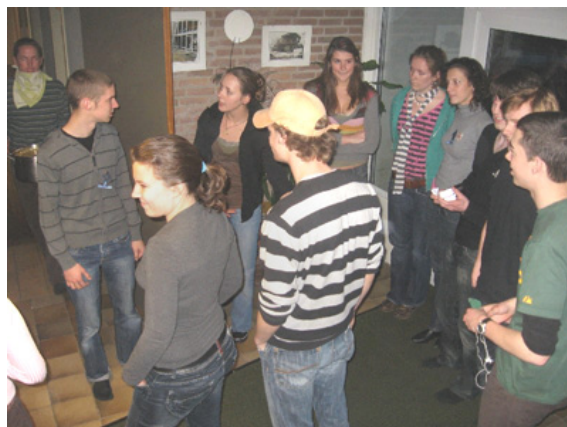
Deelnemers aan het straatkinderenweekend van SAMEN in Assel Don Bosco Centrum.