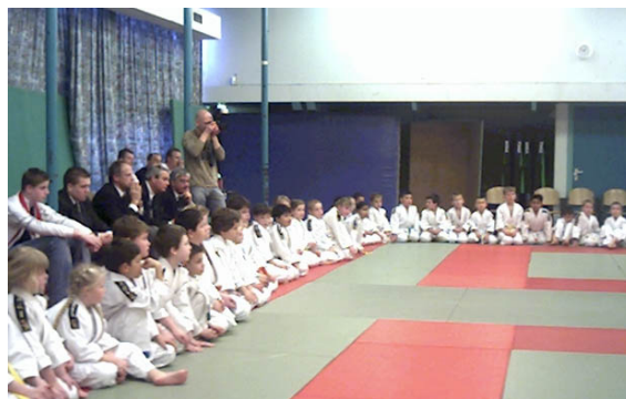
Deelnemers aan het judotoernooi zitten klaar.

Uilenhoed die het tot Europees kampioen heeft gebracht.