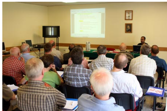
Een presentatie tijdens het seminar in Rome.

België nemen op uitnodiging deel aan dit seminar in Rome. De eerste ontmoeting heeft plaatsgevonden in Kochi, India. In India wordt voornamelijk gewerkt met internationale vrijwilligers. Het werken met lokale vrijwilligers moet om verschillende redenen nog van de grond komen. In Kochi werd lovend gesproken over de Nederlandse vrijwilligers die via SAMEN worden bemiddeld. De voorbereiding, de inzet en de follow up werden alom geprezen.