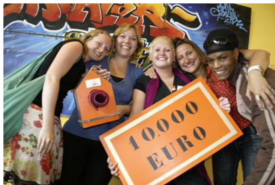
Opgetogen medewerkers van Don Bosco Jonathan vlak na de prijsuitreiking.

- Don Bosco Jonathan heeft de ‘Altijd Onderweg Prijs 2007’ gewonnen. De prijs is 20 juni in Den Bosch uitgereikt. De Altijd Onderwegprijs, ingesteld door de Stichting Zwerfjongeren Nederland, gaat jaarlijks naar een project voor zwerfjongeren. De prijs bestaat uit een geldbedrag van 10.000 euro en een wisseltrofee. Don Bosco Jonathan kreeg de prijs voor ‘FilmSpot!’. Dit project biedt dak- en thuisloze jongeren de gelegenheid reportages te maken in Amsterdamse opvanghuizen voor dak- en thuislozen. De jongeren krijgen zo de kans hun leefwereld op een positieve manier te presenteren en hun creativiteit op het gebied van filmen en acteren te ontdekken. Don Bosco Jonathan is een vrijwilligersorganisatie die dak- en thuisloze jongeren en niet-thuisloze leeftijdgenoten (17-30 jaar) met elkaar in contact brengt via allerlei activiteiten. Het Amsterdamse Don Boscowerk wil daardoor de afstand tussen zwerfjongeren en de samenleving verkleinen.