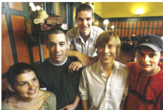
Krantenfoto van de Limburgse deelnemers aan 'Samen Naar India 2007'.