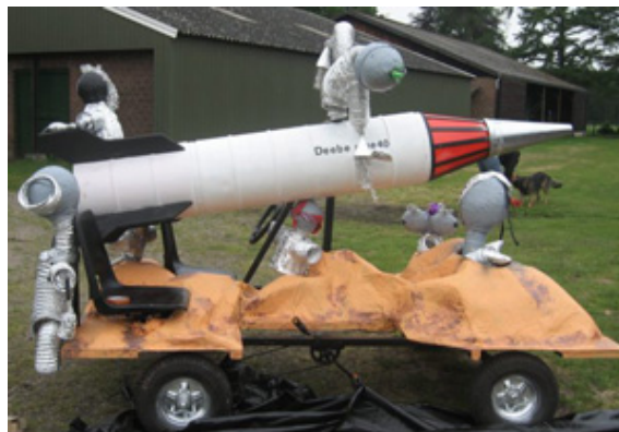
Het originele vehikel van de DeeBeetje-kampen.

- De DeeBeetje-kampen bestaan in 2007 veertig jaar. Dat werd op 28 mei in Assel Don Bosco Centrum gevierd met een reünie voor oud-deelnemers aan de kampen, (oud-)vrijwilligers en belangstellenden. Er was een rommelmarkt en kinderen konden meedoen met allerlei spelletjes. Een team van de DeeBeetje-kampen deed op 2 juni in Nieuw Vennep mee met de wedstrijd 'Gein op 't plein' van het populaire TROS-tv-programma 'Te land, ter zee en in de lucht'. Deelnemers moesten in zelfgebouwde voertuigen zo snel mogelijk een bepaald parcours afleggen en op het eind aan een bel zien te trekken. Vorig jaar lukte het niet om 'de bel' te halen, maar dit keer wél. Bovendien was het vehikel genomineerd voor de originaliteitsprijs. Het wagentje verbeeldde met een raket en een stukje maanlandschap het thema 'Ruimte zat!' van de zomerkampen die dit jaar in Assel worden gehouden.