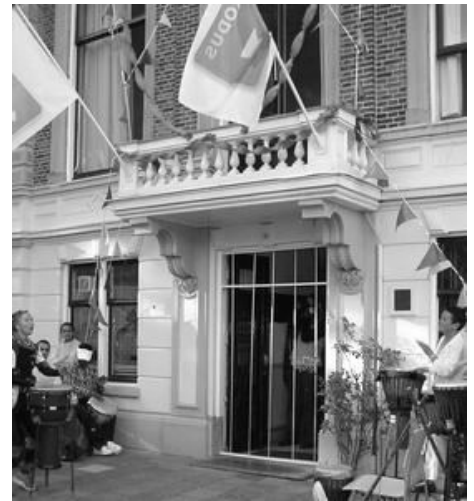
De opening van het Exodushuis in Leiden.

Het huis in Leiden is sinds maart 2002 open en gevestigd in een pand aan de Plantage, waar jarenlang de Franciscaanse leefgroep Verbum Dei heeft gewoond.