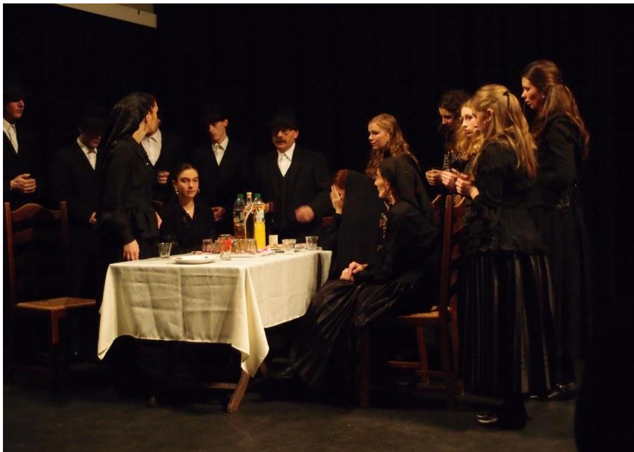
Een uitbeelding van een ritueel tijdens een rouwperiode van de Roma.