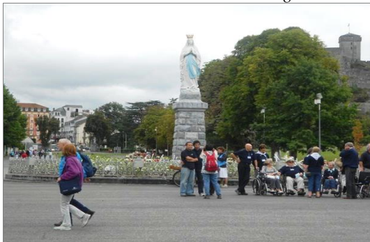
De Esplanade in Lourdes