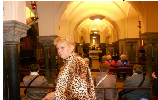
In de basiliek Rosaire