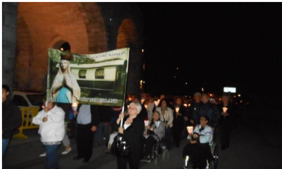
Het vaandel van de groep reizigers