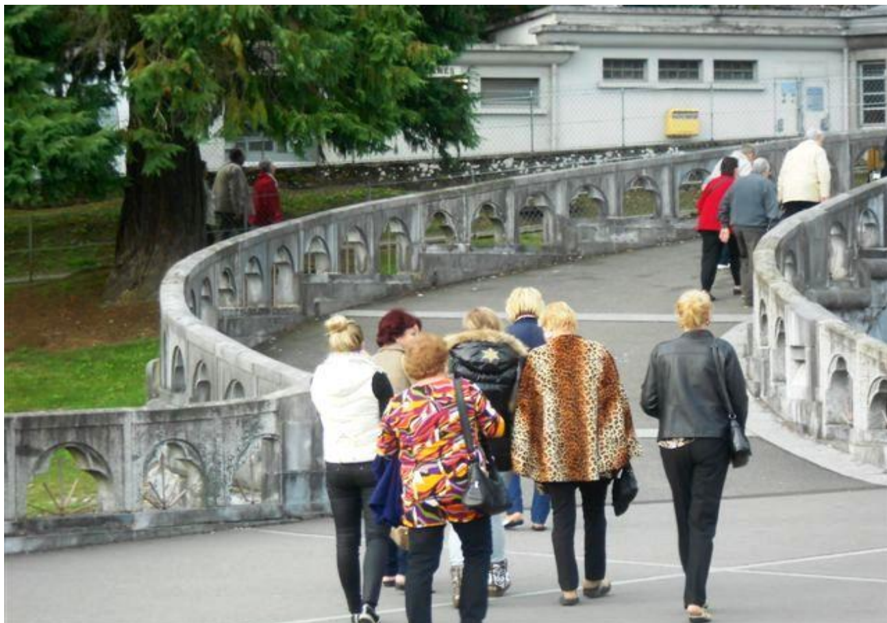
Bedevaardangers in Lourdes op weg naar de basiliek Rosaire. Foto: Margo Scholten, 2013