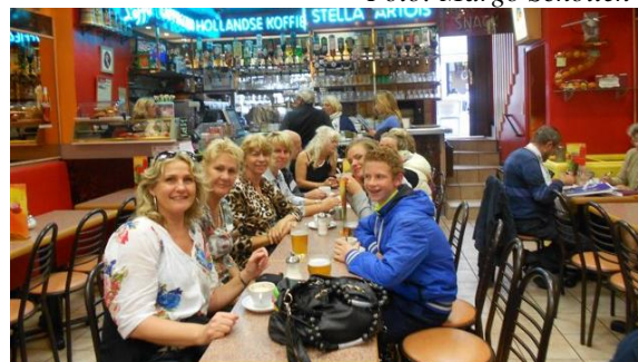
Nog even gezellig wat drinken in Lourdes