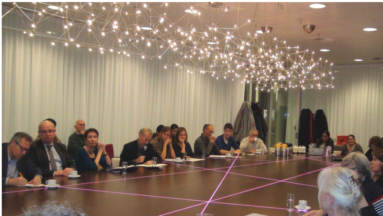
Bijeenkomst in het gemeentehuis van Nieuwegein op 26 november 2013, met burgemeester Backhuijs (2 de van l.), een aantal vertegenwoordigers van het PWN en Roma. Lees erover op pagina 5.