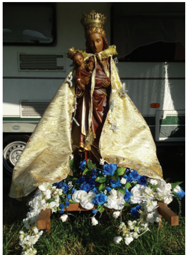
Beeld van Onze Lieve Vrouw in 't Zand te Roermond tijdens de Sinti-bedeveert

Ik ben twee keer gedoopt. Eén keer als baby voor de katholieke kerk en één keer toen ik zestien was voor een andere godsdienst. Ik ben nu weer katholiek omdat ik vind dat de katholieke kerk de hele bijbel verkondigt en niet alleen de mooie stukken eruit haalt die mensen voor zich zelf graag horen. En als je over