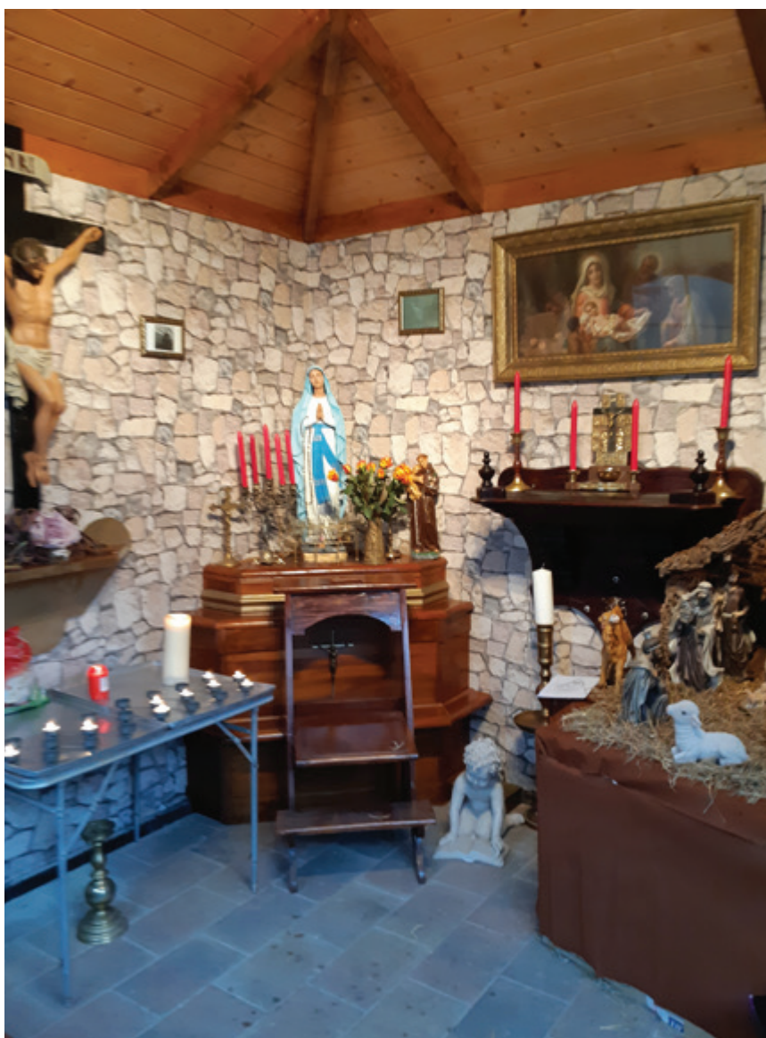
Kapelletje in Emmen