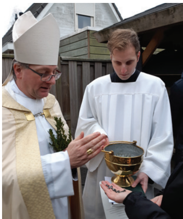
Bisschop zegent rozenkrans

Nadien komen mensen met rozenkransen en kruisjes om door de bisschop te laten zegenen.