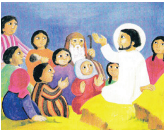
Heer leer ons bidden

T'AVES BACHTALI SUNTO MARIA, TU KAJ SAN PHERDO ERTIMO. O DEL I TUSA. TU KAJ SAN I SUNTO ZHUVLI MASHKERAL E ZHUVLA THAJ O JESUS SI BENIME TJIRO SUNTO SHAVO. SUNTO MARIA, LE DEVLESKI DEJ, RUDIN TUT AND'AMARO BEZECH AMENDE, AKANAK THAJ KANA AVELA O TSHASO MERIMASKO. AMIN.