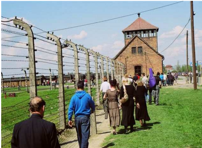
Sinti in Auschwitz-Birkenau, 2006

Na deze ontsnapping volgde een tijd van ontberingen en angst in de onderduik. Iedere dag bang om opgepakt te worden. Tot het moment van de bevrijding door de geallieerden, voorjaar 1945. Na de bevrijding was nog het ergste de onzekerheid. Leefde mijn familie nog en zouden ze terugkomen? Daarna volgde het checken van die lange Rode Kruis-lijsten met de namen van vermoorde mensen.