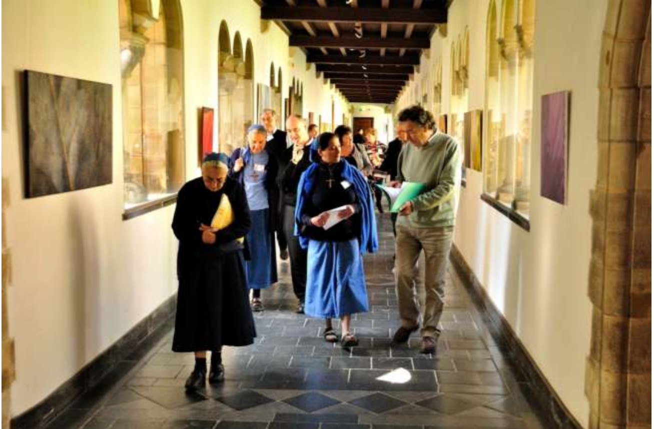
Deelnemers aan de internationale conferentie van het CCIT in Rolduc, Kerkrade, onder wie enkele Kleine Zusters van Charles de Foucauld.