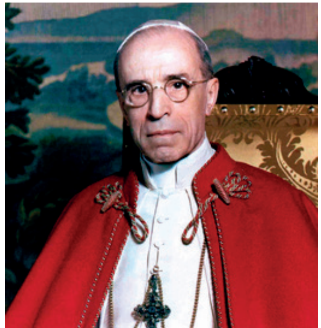
Paus Pius XII