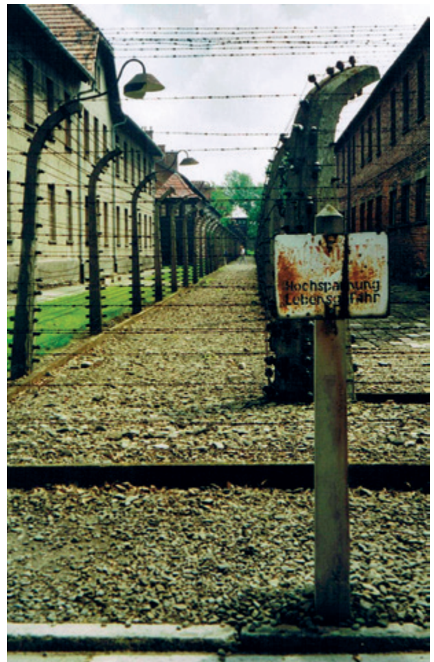
Het prikkeldraad Auschwitz

Naast vele Joden, militairen en burgers zijn ook woonwagenbewoners, Sinti en Roma in de vorige eeuw slachtoffer geworden van de gruwelijke wereldoorlogen. Woonwagenbewoners, Sinti en Roma hebben als reizende volken onderweg in hun levensonderhoud moeten voorzien. Al reizend om den brode hebben zij veel weerstand ondervonden