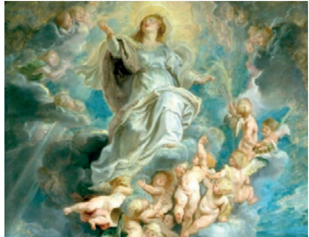
Maria ten Hemelopneming

De Tenhemelopneming van Maria is een feest voor de hele mensheid. Het zegt dat elk mens door God is geschapen en in die hoedanigheid de hand van de Schepper in zich draagt. Maria is het prototype van die mens. Zij heeft Jezus in zich gedragen hem opgevoed en hem van nabij gevolgd in zijn missie en uiteindelijk, na haar heengaan, in Hem haar voltooiing gevonden in het Vaderhuis van de hemel. De woonwaggenbewoners, Sinti en Roma, hebben het geloof en het vertrouwen in hun God en zijn moeder nooit opgegeven. 'Niet God was schuldig aan de vernietiging van hun volk en andere volken maar de mens die God en zijn Geest verloochenden'.