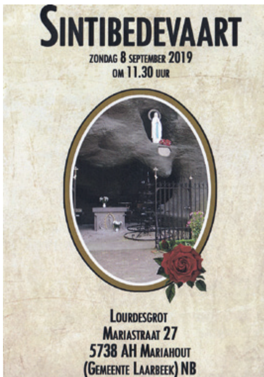
Folder Latcho Diewes

Na de overweging vieren we de eucharistie aan de grot met de begeleiding van het Sintimuziek. In de middag zal het festival terrein in Sint Oedenrode weer open zijn voor muziek en cultuur. Het is prachtig najaarsweer en er worden weer duizenden bezoekers verwacht.