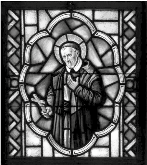
Vincent de Paul contempleert het Kruis als Licht van de clerus, zoals afgebeeld in de kapel van het Vincentius Huis van het Sint Joseph Seminarie in Princeton

als God het wil, dat is het te doen in liefde, in liefde, mijn dochters. Oh! dat dát jullie dienst excellent moge maken! Maar weten jullie wat dat wil zeggen: doen in liefde? Dat is: doen in God, want God is liefde, dat is: het volkomen zuiver om God doen”.