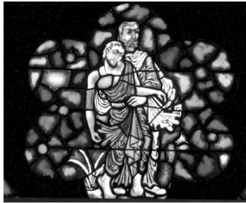
Gebrandschilderd raam van de Barmhartige Samaritaan in de Catharinakerk in Eindhoven

Drie middagen per week (dinsdag, donderdag en vrijdag) houdt het Steunpunt Materiële Hulpvragen een spreekuur in de Catharinakerk. Cliënten kunnen zich hiervoor telefonisch aanmelden. Tijdens dit spreekuur zijn er altijd twee spreekuurmedewerkers aanwezig; één om het gesprek met de cliënt te voeren en één om te notuleren. Afhankelijk van de hulpvraag kan de cliënt direct geholpen worden (bijvoorbeeld met leefgeld of tweedehands meubels), maar soms is de hulpvraag com-