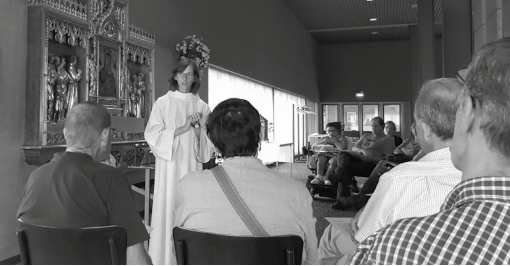
Viering in het straatpastoraat