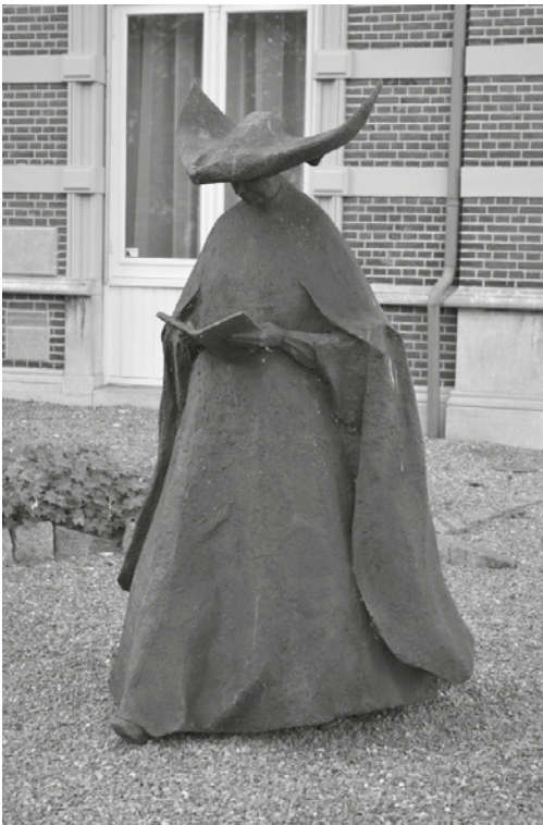
Beeld Liefdeszuster van St. Vincent de St. Paul de Chartres in Breda door Jos van Riemsdijk 1990