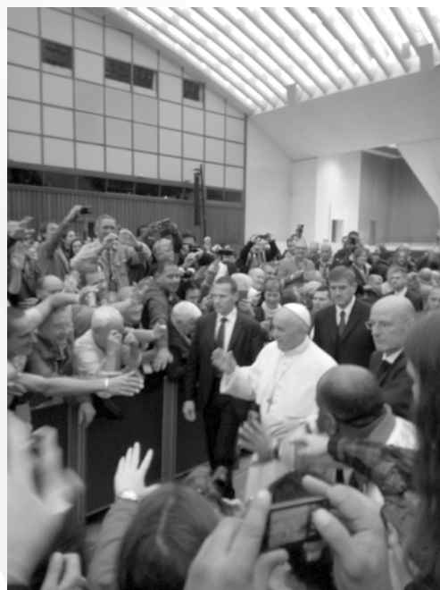
Paus Franciscus tijdens de audiëntie op vrijdag 11 november.

Een bijzondere reis die mede door de vele giften van organisaties en fondsen mogelijk gemaakt is en voor de deelnemers onvergetelijke momenten in hun leven hebben op-