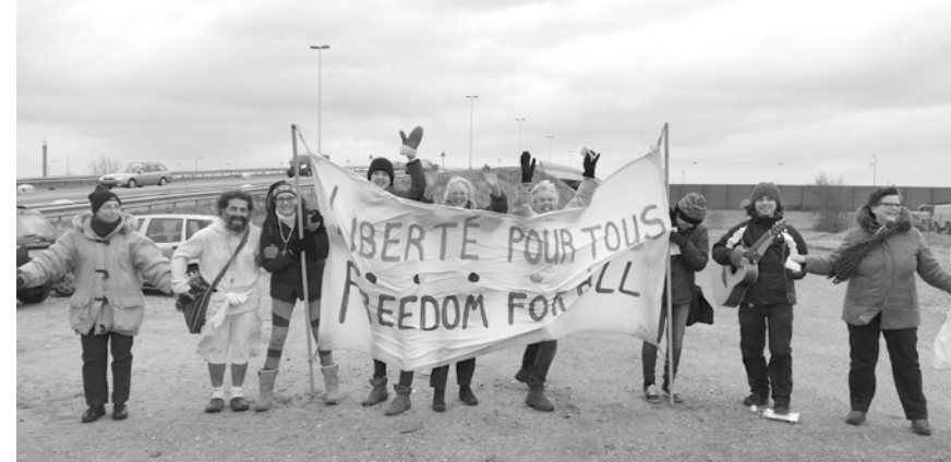
Liberté pour tous - Freedom for all - wake bij Schiphol Airport

Als kernteam kiezen we er bewust voor om niet liefdadigheid van ‘bovenaf’ aan te bieden,