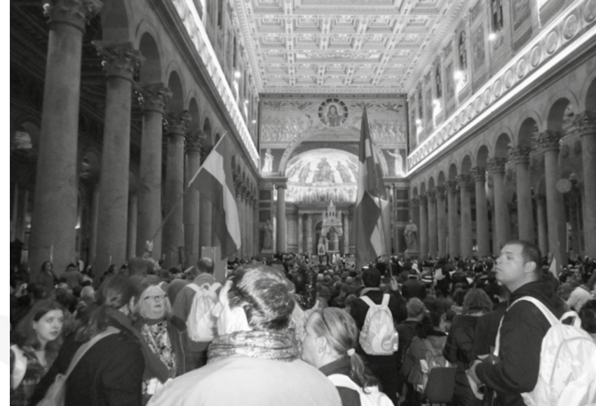
Dak- en thuislozen bedevaart in Rome

De Nederlandstalige priester zei na afloop “nog nooit zoveel achtereen biecht te hebben gehoord. Merk a.u.b. op, dat het niet begon met de biecht. Het begon met uitnodiging, met tijd en aandacht, begrip voor de bijzondere omstandigheden en daaruit vloeide verlangen voort naar bekering of beter gezegd omkering, omdat hoop groeit. Geloof en