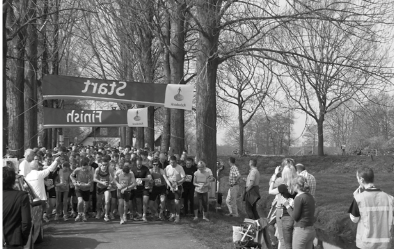
De start van de jaarlijkse Polderloop

er een kindertehuis, waar zo'n zestig kinderen verblijven die te ver van school wonen. Vanuit een sociaal centrum worden activiteiten gestimuleerd, en de lokale bevolking maakt zelf de dienst uit. In overleg met de Stichting wordt beslist welke prioriteit er opgepakt wordt en gesponsord. Armoede is in dit gebied nog teveel een constante factor: geen schoenen om naar school te lopen, geen geld voor een uniform. De lokale leiders gaan er op af en steunen daar waar ze kunnen. Regelmatig bezoeken vrijwilligers Friersdale, betrokken als ze zijn bij dit thuisfront nieuwe stijl, en zij brengen steeds de nieuwe verhalen mee.