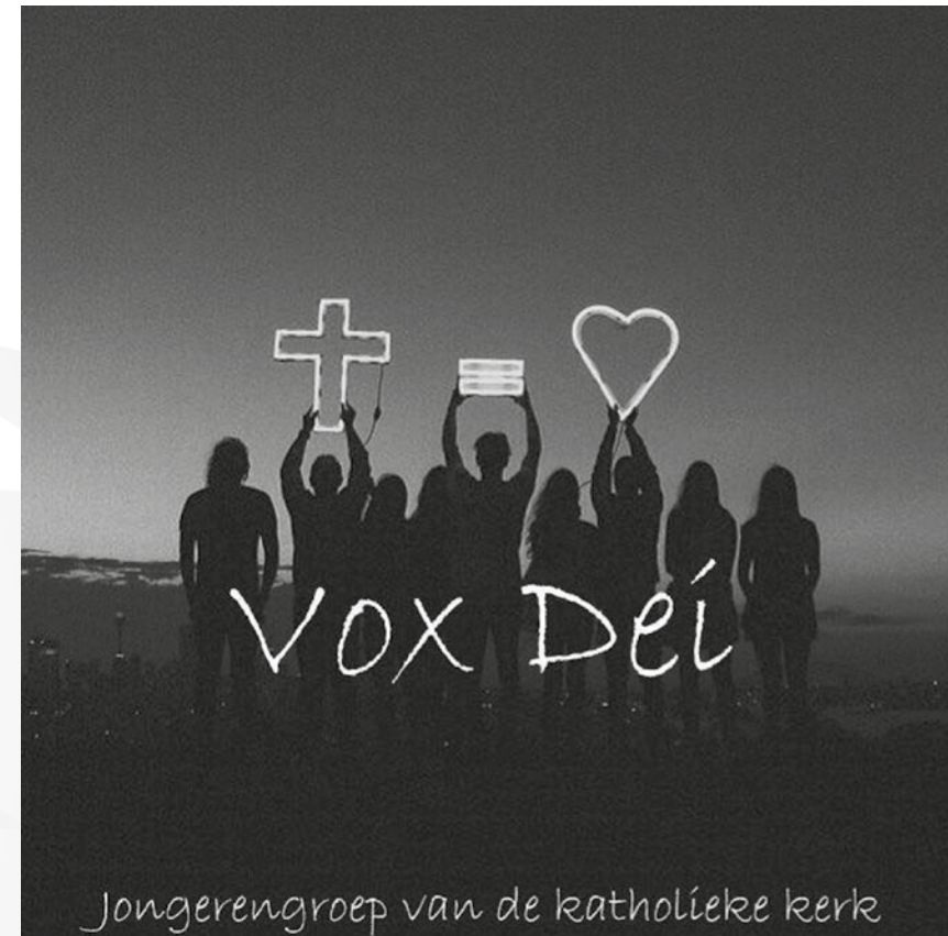
Het logo van de jongerengroep in de parochie is Vox Dei

Het doel van het IPO jongerenproject is dat jongeren een actieve rol vervullen binnen de kerk. Dus bijvoorbeeld een jongere als koster of een jongere in het kerkbestuur of verzin het maar. Het idee is dat jongeren meer verbondenheid voelen wanneer ze een actieve rol vervullen. Zo blijven jongeren bij de kerk betrokken en wordt vergrijzing tegen gegaan. Een mooi idee waar we naar toe willen werken. Maar om deze actieve betrokkenheid tot een blijvend succes te maken is er meer nodig dan een drammeleiders,