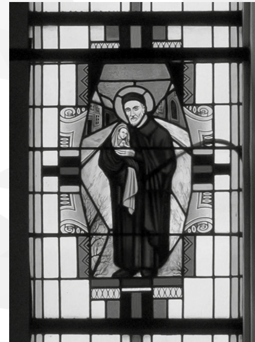
Vincentius de Paul in de kapel van zorgcentrum St. Joris Oirschot

‘liefdewerk’, caritas genoemd. Ik gebruik de termen ‘diakonie’ en ‘caritas’ nu dooreen. Wat voor diaconia caritatis beoefende Vincent? Al lezend komen een paar kenmerken naar voren.