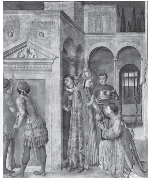
Het overgeven van de kerkschatten, fresco van Fra Angelico in kapel van paus Nicolaas V Vaticaanstad

Laurentius is patroon van een hele reeks groepen, die alle een relatie hebben met zijn leven. Zo is hij patroon van de armen en van diakens en bedienend personeel (hij diende immers zelf de bisschop). Voorts van bibliothecarissen en archivarissen en andere