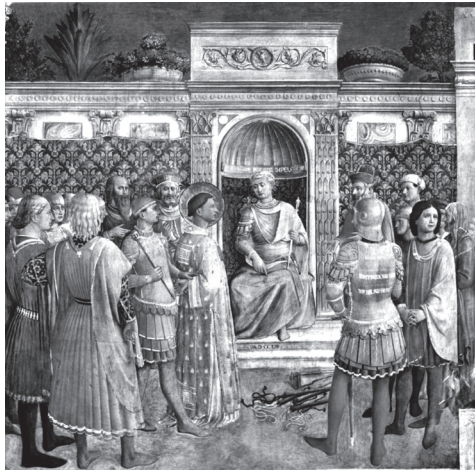
Laurentius voor het gerecht, fresco van Fra Angelico in kapel van paus Nicolaas V Vaticaanstad

dood van Sixtus, maar omdat hij zelf moest achterblijven. Daarom riep hij hem toe: “Waar gaat u heen, vader, zonder uw zoon? Waarheen haast u zich, bisschop, zonder uw diakens? Nooit bracht u een offer zonder uw dienaar. Wat bevalt u niet in mij, vader? Hebt u soms ooit gemerkt dat ik mijn taak verwaarloosd heb? Neem de proef op de som. Dan kunt u zien of u wel de geschikte dienaar hebt uitgekozen. U hebt hem de wijding toevertrouwd van het bloed van de Heer en als u de sacramenten voltrok, liet u hem daarin delen. Maar nu u uw bloed vergiet, ontzegt u hem daaraan deel te hebben?”