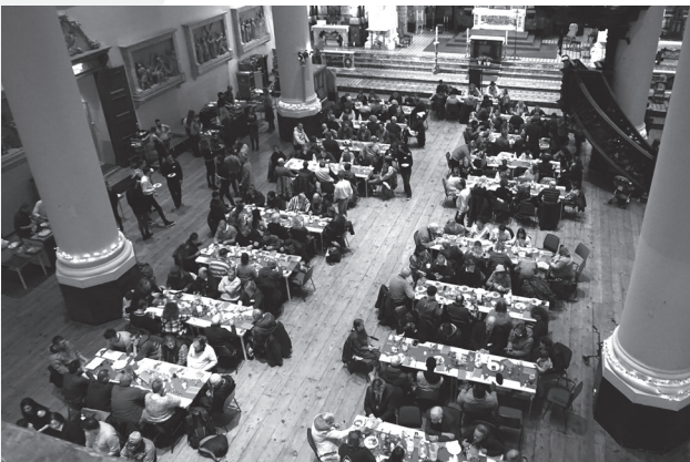
Kerstdiner in de Mozes en Aäronkerk

Mijn adagium en mijn ervaring is dat caritas niet zo ingewikkeld hoeft te zijn. Als Nederlanders aan Sant’Egidio vragen wat er nodig is om een School van Vrede te starten: een wekelijkse activiteit van jongeren voor kinderen van de basisschoolleeftijd, dan zeggen wij meestal: “Een bal, je hebt alleen een bal nodig. Maar het kan ook zonder bal.”