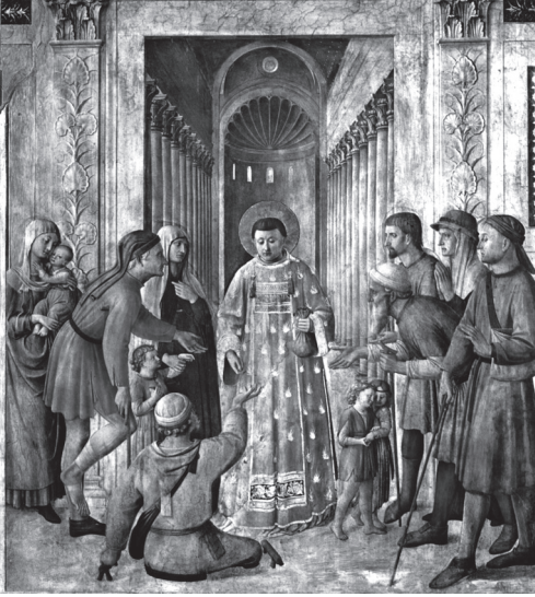
Verdelen van de kerkschatten, fresco van Fra Angelico in kapel van paus Nicolaas V Vaticaanstad

goed verhaal verpesten met de waarheid? Hoe wreder de terechtstelling, des te groter was de triomf van de martelaar in de ogen van de gelovigen.