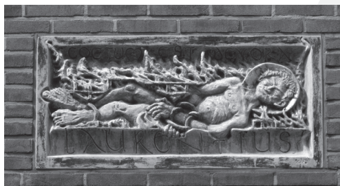
Muursteen van St Laurentius in de Sint Laurensstraat te Alkmaar

Nederland kent 22 rooms-katholieke Sint Laurentiuskerken, 32 hervormde kerken onder het (voormalige) patronaat van Laurentius en 2 oud-katholieke kerken. Tot de meest bekende plaatsen horen Alkmaar en Rotterdam. Die grote verspreiding heeft niet alleen te maken met het voorbeeldige leven van Laurentius. Op Laurentiusdag 955 versloeg keizer Otto I de Hongaren bij Augsburg. Sindsdien gold Laurentius als veldslagheilige. Niet toevallig zijn er veel Laurentiuskerken te vinden in het grensgebied van Holland en West-Friesland.