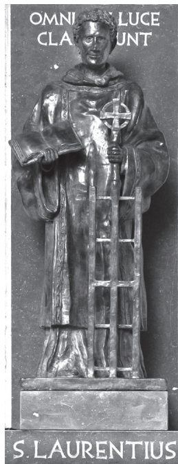
Laurentius beeld op de begraafplaats en crematorium Sint Laurentius te Rotterdam

Sixtus zou minder dan een jaar bisschop van Rome zijn. Hij was een van de slachtoffers van de christenvervolgingen door keizer Valerianus en werd op 6 augustus 258 onthoofd. Laurentius zou hem enige dagen overleven en stierf de marteldood op 10 augustus 258.