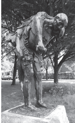
De Barmhartige Samaritaan, beeld van Piet Esser

De werkgroep Caritas/Diaconie komt vier keer per jaar bij elkaar, waarvan twee keer met de gehele overleggroep. Bij eenmalige acties (o.a. 2016 Scheepsmaatjesproject) en calamiteiten overlegt men op ad-hoc basis. Met de andere kerken in Joure wordt een keer per jaar afgestemd.