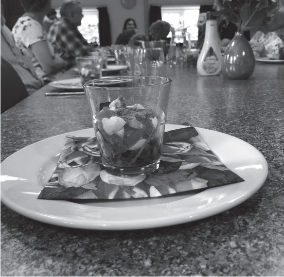
Aandacht voor tafelaankleding met bloemen

Onze ervaring is dat de beloning niet pas bij de opstanding komt, maar er ook nu al is in de gedeelde vreugde die de nodigende partij en de gasten samen beleven.