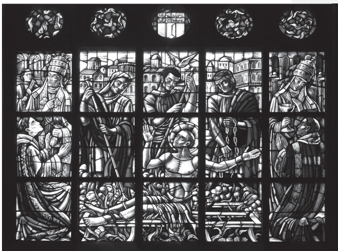
Laurentius glas-in-loodraam in kathedraal Rotterdam

Volgens de legende werd hij in zee geworpen met een molensteen om zijn nek, maar bleef hij gewoon drijven. Daarna werd hij letterlijk geroosterd. Hij was de eerste martelaar in Spanje. Volgens sommige historici heeft zijn dood model gestaan voor het verhaal, dat over Laurentius' einde de ronde doet. In Rome was halverwege de derde eeuw het langzaam braden op een rooster onbekend. Meer voor de hand lag onthoofding, zoals het geval was bij Sixtus en de vier diakens, die bij hem waren. Maar waarom een