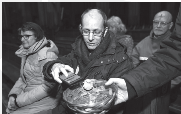
Hedendaags collecteren

Daar voegt zich nog een derde doel bij, namelijk de verhouding van gelovigen uit de Joden en gelovigen uit de heidenen die ook in de tijd van Paulus onder spanning staat. Door goede werken voor elkaar te doen hoopte Paulus dat de verstandhoudingen verbeteren.