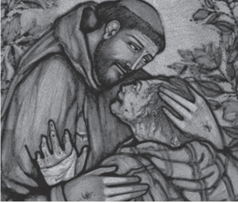
Sint Franciscus ontfermt zich over een melaatse

ons. “Wat zou de wereld anders zijn als...” is een verzuchting die u misschien ook kent. Heel menselijk, zeker voor idealisten. Maar hij kan een donkere achterkant hebben als hij voortkomt uit verongelijkheid en zelfbeklag. Die donkere achterkant kan verdrongen boosheid, gekrenkte trots en angst voor de toekomst zijn. Deze gevoelens kunnen zich hullen in de intellectuele jas van de cultuurkritiek. Denk aan wat Van den Berk zei over verdringing.