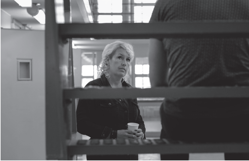
Vrijwilligersbezoek op de afdeling