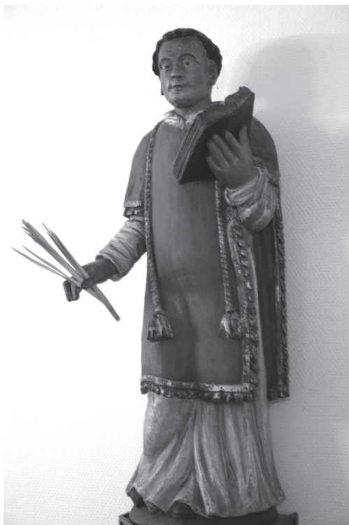
Beeld van Laurentius op het bureau Bisdom Rotterdam

beroepen die met een boek te maken hebben van studenten tot schrijvers en van advocaten tot boekhouders (omdat hij als diaken de heilige boeken in bewaring diende te houden). Daarom wordt hij ook vaak afgebeeld met een boek. Maar hij is ook patroon van beroepen waarbij vuur een rol speelt, zoals brandweerlieden, glazeniers en glasblazers, kolenbranders, koks en koekenbakkers (omdat hij gegaard werd op een rooster). Ook een rooster is daarom een van zijn attributen.