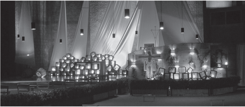
Impressie van kerk in Taizé

komt omdat er wordt gesproken over het goede en het ware, maar op een wijze dat onze innerlijke zoektocht en de donkere kanten van ons bestaan buiten beeld blijven. De taal raakt losgezongen van de weerbarstige werkelijkheid, waar goed en kwaad, licht en donker door elkaar lopen, buiten ons maar ook van binnen. De voorbeden klinken mooi, maar de taal is uiteindelijk abstract. De kwetsbare, gewonde, arme mens is in deze voorbeden object van zorg, geen godzoeker, geen subject van geloof. En God? Die lijkt soms haast een voetnoot geworden voor de lector; oh ja, laat ik nog zeggen dat we God moeten vragen om kracht. Veel voorbeden passen bij een beschermd wereldbeeld, waarin niet zoveel plaats is voor de eigen kwetsbaarheid. Pijn, verdriet, lijden, verscheurdheid, onmacht: dat is bij anderen. Het voelt fijn dat de lijdende een ander is, waarover jij, de bevlogen christen die gelukkig aan de goede kant staat, zich mag ontfermen. Het voelt fijn, maar de realiteit van jezelf en van de wereld is anders. Als je het goede wilt doen, als je trouw wilt blijven aan je diepste overtuigingen, kom je onherroepelijk ook jezelf tegen, met je beperkingen, schokkende ervaringen, blinde vlekken en zo meer. Spiritueel leven is juist: wat er echt in je leeft onder ogen zien, doorleven en inbrengen in je relatie met God. Ook in het gebed van de gemeenschap waar onder ogen wordt gezien, wat we op eigen kracht niet reddend.