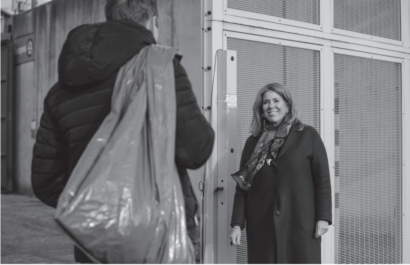
Vrijwilliger haalt ex-gevangene op bij de gevangenis

raakte me. Het kwam dichtbij. Dit had mij ook zomaar kunnen overkomen.”