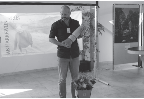
Neo de Bono met kunstwerk