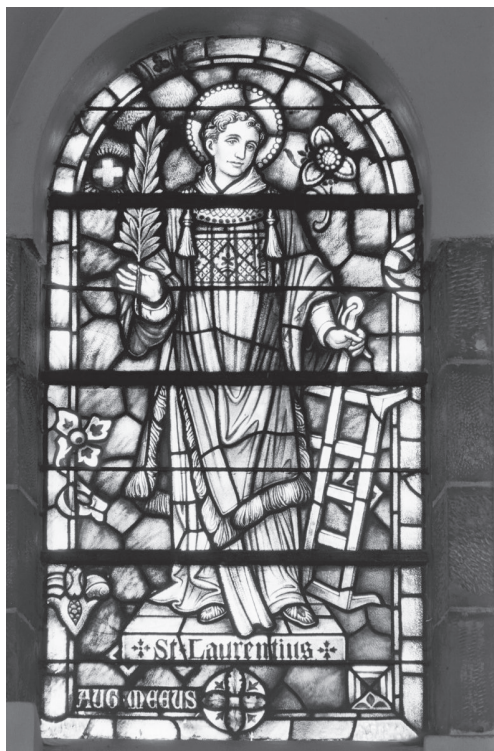
Glas-in-loodraam van Sint Laurentius in Spaubeek